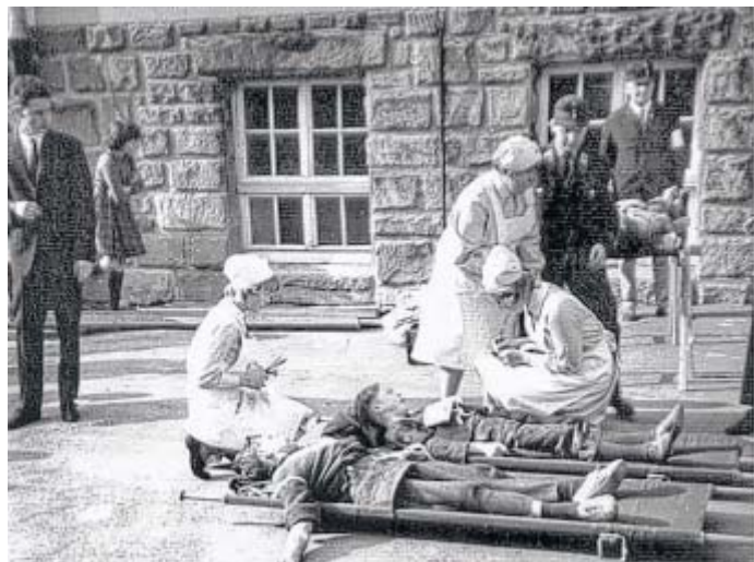
Training: Wie Verletzte versorgt werden, lernen die jungen Rotkreuzler 1957 bei einer Übung an der Bürgerschule.

♦ Helmut Wessel: Die Geschichte des Roten Kreuzes in Vlotho. Eigenverlag 2014.