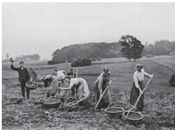
Kartoffelernte: Der Fotograf Fenske hat diese Szene in den 30er-Jahren in Eickum aufgenommen.

◆ Dieter Brunwig: 125 Jahre evangelisches Krankenhaus Bünde, Verlag für Regionalgeschichte Bielefeld 2015 (Herforder Forschungen, Bd. 25); 336 Seiten, viele Abbildungen.