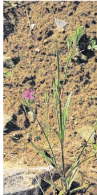
Ein Neuling in der Region: Die Büschelnelke.

Büschel-Nelken lieben Licht, Wärme und Trockenrasen, sie wachsen entlang von Gebüschsäumen und haben mit fetter Grasvegetation nichts am Hut. Wenn der kleine Standort in Vlotho von Büschen und Brombeeren überwuchert werden sollte, was zu befürchten ist,