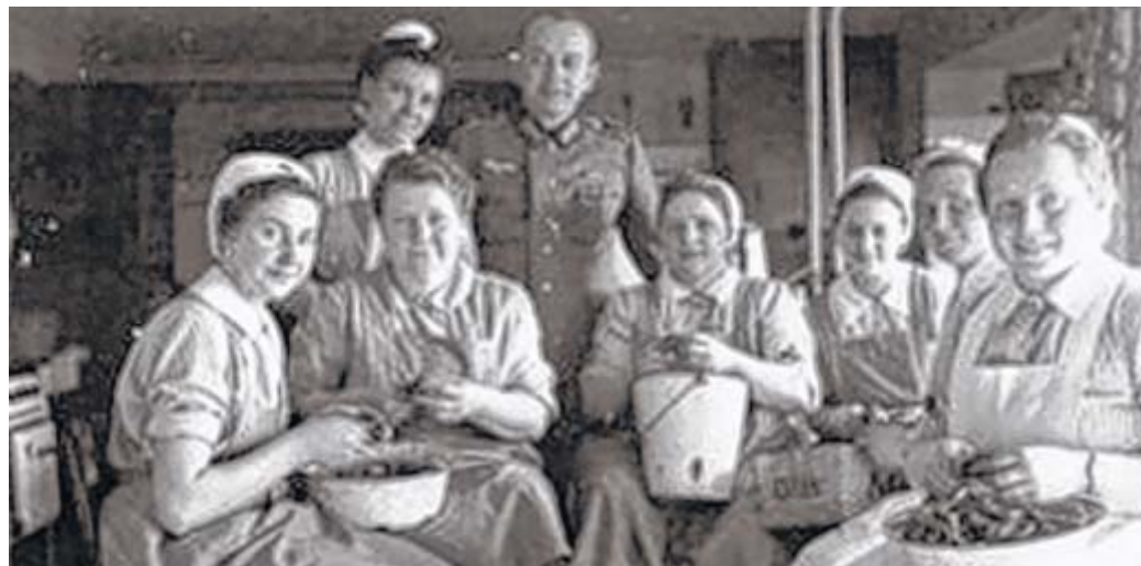
Essen machen: Im Löhner Soldatenheim bereiten 1942 die Frauen vom Vlothoer Roten Kreuz Mahlzeiten vor.