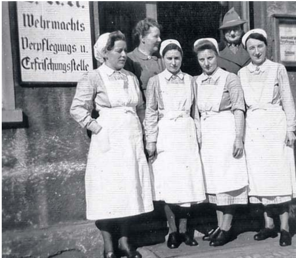
Einsatz in Löhne: Während des 2. Weltkriegs taten die Rot-Kreuz-Frauen aus Vlotho Dienst am großen Löhner Bahnhof. Hier wurden Wehrmachtssoldaten auf der Durchreise verpflegt.