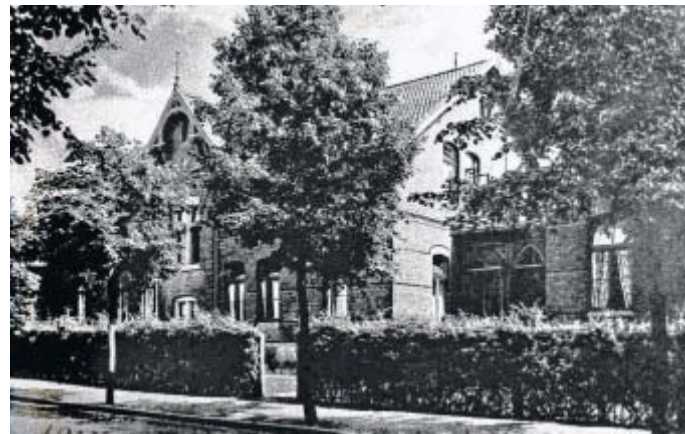
Von Bänder Bürgern gebaut: Das Krankenhaus um 1900.

In welchem Geist und mit welchem Anspruch an der Bänder Brunnenstraße alles angefangen hat, wird in einem Zitat von Bodelschwingh vom Januar 1886 deutlich: „Niemals darf ein solches Haus engherzig sein; es muss ein wirkliches Haus der