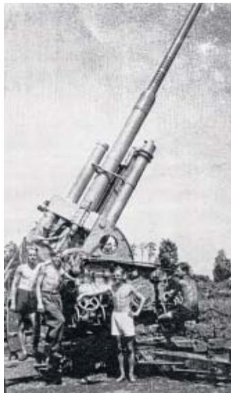
Letztes Aufgebot: Herforder Schüler an einer Flakstellung 1944.