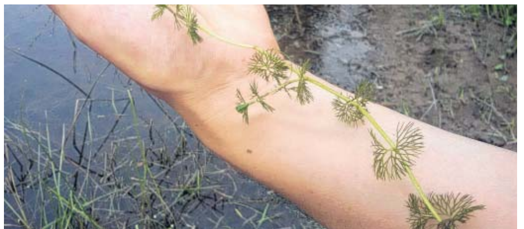
In der Weseraue entdeckt: Der Spreizende Wasserhahnenfuß braucht klare Gewässer mit Schlamm- oder Sanduntergrund.

Sie zu ersetzen, geht kaum: Neue Platten sind nicht mal auf dem Blasheimer Markt zu bekommen. Aber wo ein Wille ist, ist vielleicht auch eine Gießerei. Christoph Mörstedt