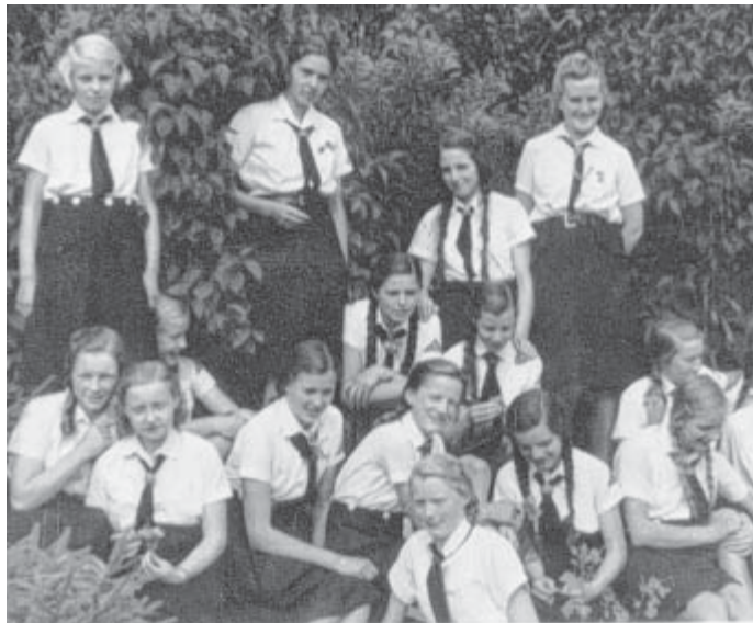
Jungmädels Einsatz: Schülerinnen der Königin-Mathilde-Schule begleiteten die Kinderlandverschickung ins heutige Tschechien 1944.